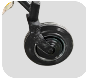
Ruedas delanteras de caucho macizo orientables 360°.