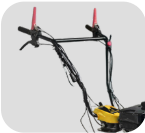
Manillar ajustable en altura y lateralmente sin necesidad de usar herramientas.