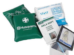
KIT DE PRIMEROS AUXILIOS 504 09 53-01