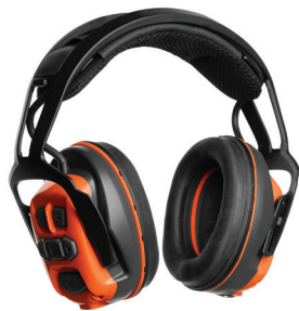
PROTECTORES AURICULARES X-COM R 595 08 40-01