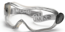
GAFAS DE PROTECCIÓN, GOGGLES 544 96 39-01