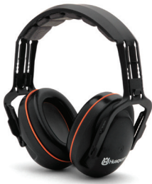
PROTECTOR AURICULAR 505 66 53-04