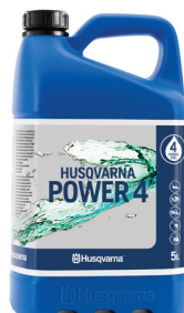
GASOLINA XP® POWER 4T 583 95 59-01