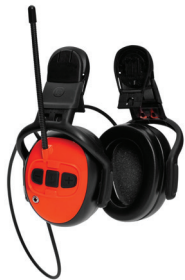
AURICULARES PARA CASCOS CON RADIO FM 578 27 49-04