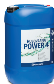
GASOLINA XP® POWER 4T 583 95 59-02