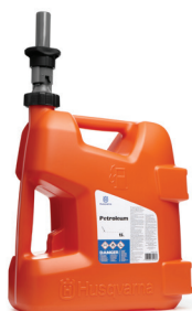
BIDÓN COMBUSTIBLE 580 75 45-01