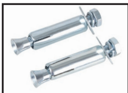
Kit de fijación