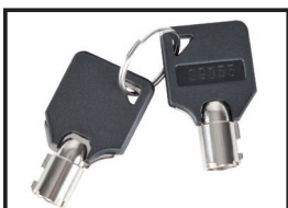
Llaves de emergencia