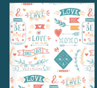
Funda 100% algodón.