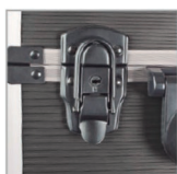
Cierre con llave