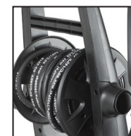
CARRO MANGUERA ALTA PRESIÓN 8 m