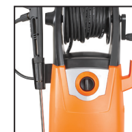
MOTOR DE INDUCCIÓN 2.800 rpm