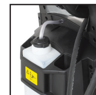
DEPÓSITO PARA DETERGENTES 1.000 ml