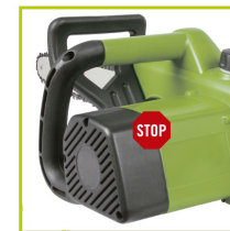
FRENO ELÉCTRICO DE CADENA