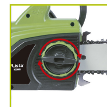
TENSOR DE CADENA SIN HERRAMIENTAS