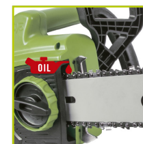
LUBRICACIÓN DE CADENA AUTOMÁTICA