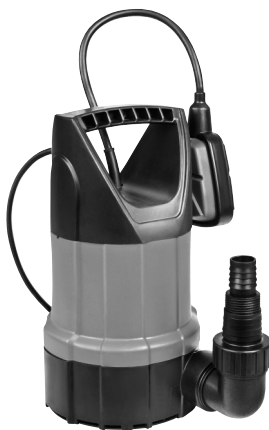
Serie AL 7993 X 411