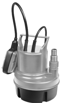
Serie AL 7993 X 410