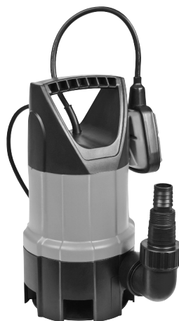
Serie AS 7993 X 412