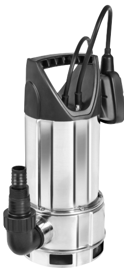
Serie AS 7993 X 415