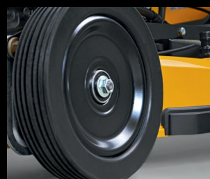
LLANTAS DE ACERO