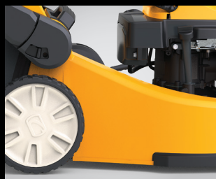
RUEDAS ULTRA ROBUSTAS