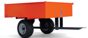
REMOLQUE PROFÍ 953 51 17-02