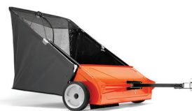
BARREDORA 112 CM 586 63 65-01