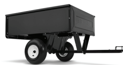
CARRO 967 02 71-01