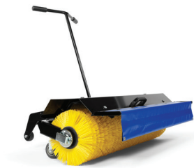
CEPILLO ROTATIVO 587 02 47-01