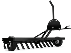
RASTRILLO DE GRAVA 953 51 24-01