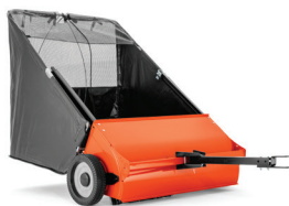
BARREDORA - 507 L 582 71 99-01