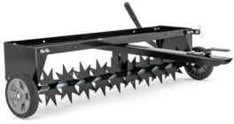
ESCARIFICADOR 586 63 67-02