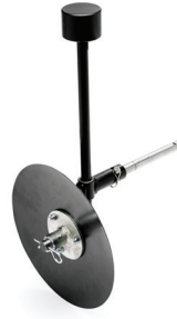
RECORTABORDES RIDER 953 53 10-01