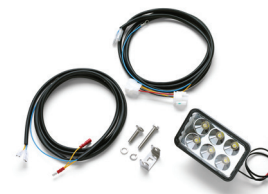
KIT DE FAROS LED 581 12 54-01