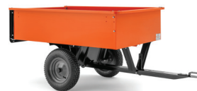
TRAILER 275 501 00 82-01